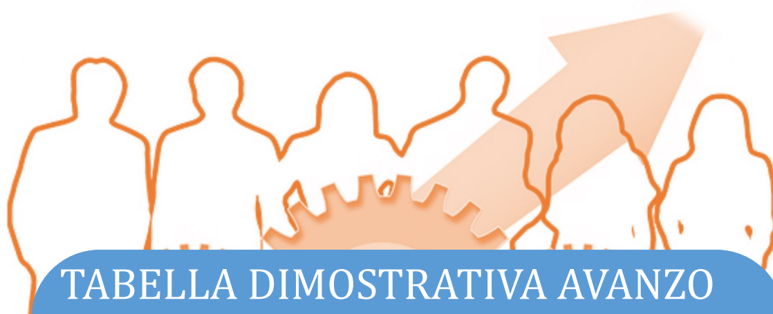
TABELLA DIMOSTRATIVA AVANZO AMMINISTRAZIONE