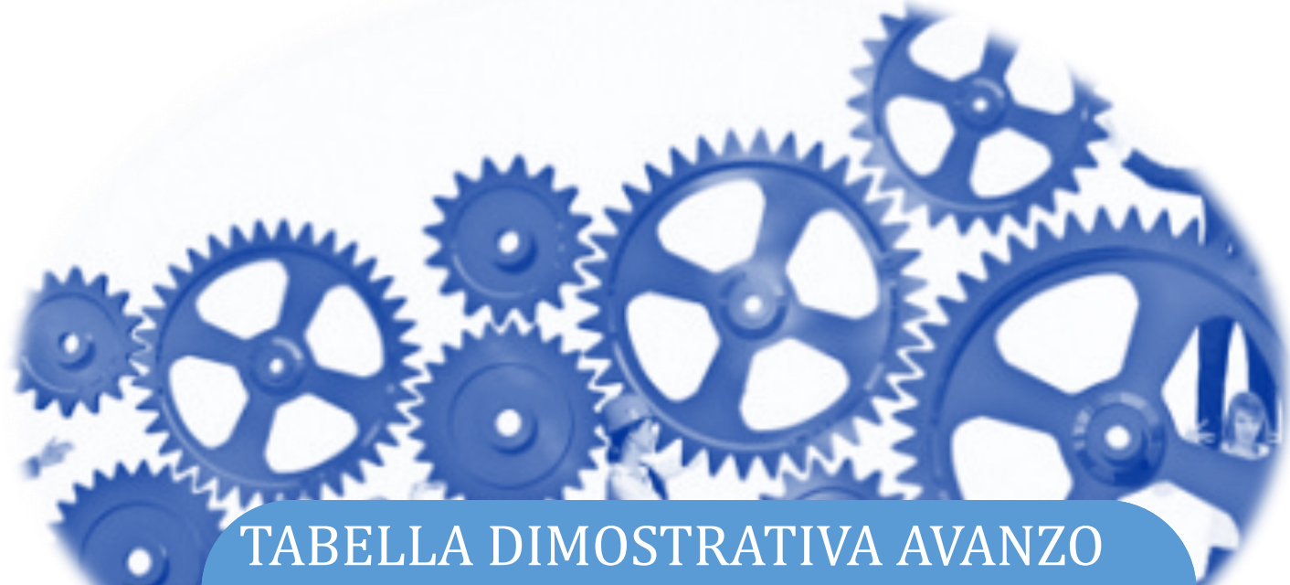
TABELLA DIMOSTRATIVA AVANZO AMMINISTRAZIONE